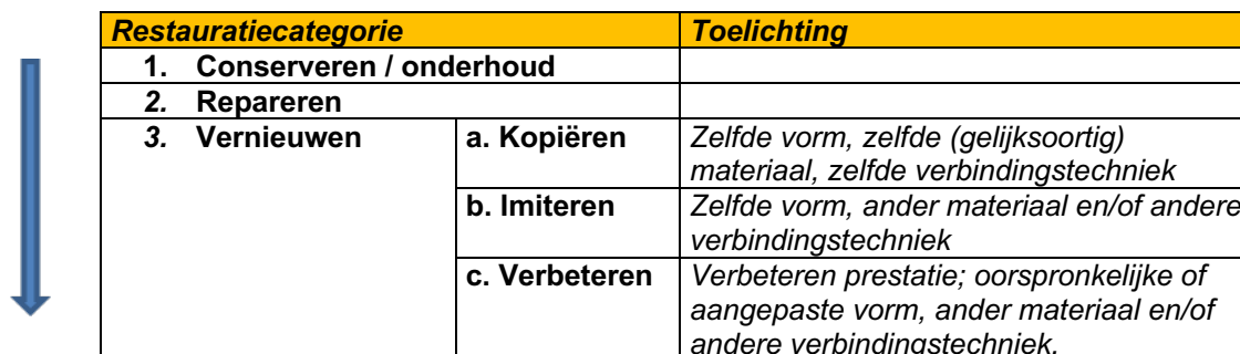
Tabel 1: Hiërarchie van restauratiecategorieën (restauratieladder)

De hier beschreven uitgangspunten vormen overigens ook een goed uitgangspunt bij ingrepen bij gebouwen en objecten zonder de status van beschermd monument.