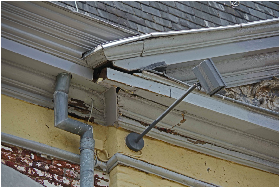
Niet alles is volledig zichtbaar. Kennis en ervaring zijn daarom belangrijk bij het inspecteren.