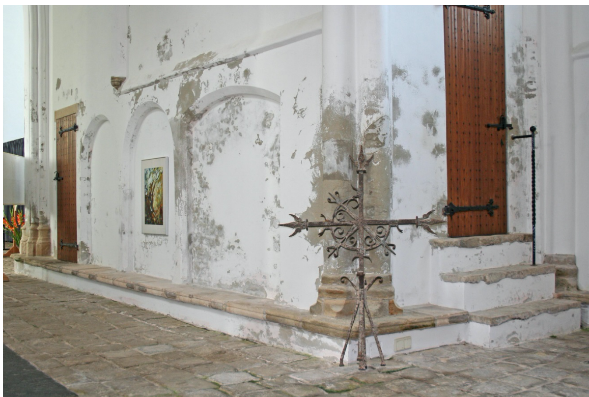
Aangetast pleisterwerk dat alleen begrepen kan worden als men weet dat in de kerk 2,5 m zout water heeft gestaan tijdens de Watersnoodramp in 1953.

Onder situering verstaan we de plaats waar het gebouw staat en op welke grondsoort. Is dit in het Groene Hart op een veenpakket, op het zand van het Drents Plateau of aan een rivierdijk op klei en kwelwater? Verder maakt het een aanzienlijk verschil of een gebouw aan de kust staat met een zilt klimaat, middenin Amsterdam of in een luwe bosrijke omgeving in het oosten van het land. Let verder ook nog op de begroeiing direct om het gebouw, zoals grote bomen die met hun zwiepende takken de dakpannen beschadigen of het riet dat versneld slijt door afdruiwend water. Bomen die te dicht bij het gebouw staan kunnen bijvoorbeeld de fundering omhoog drukken.