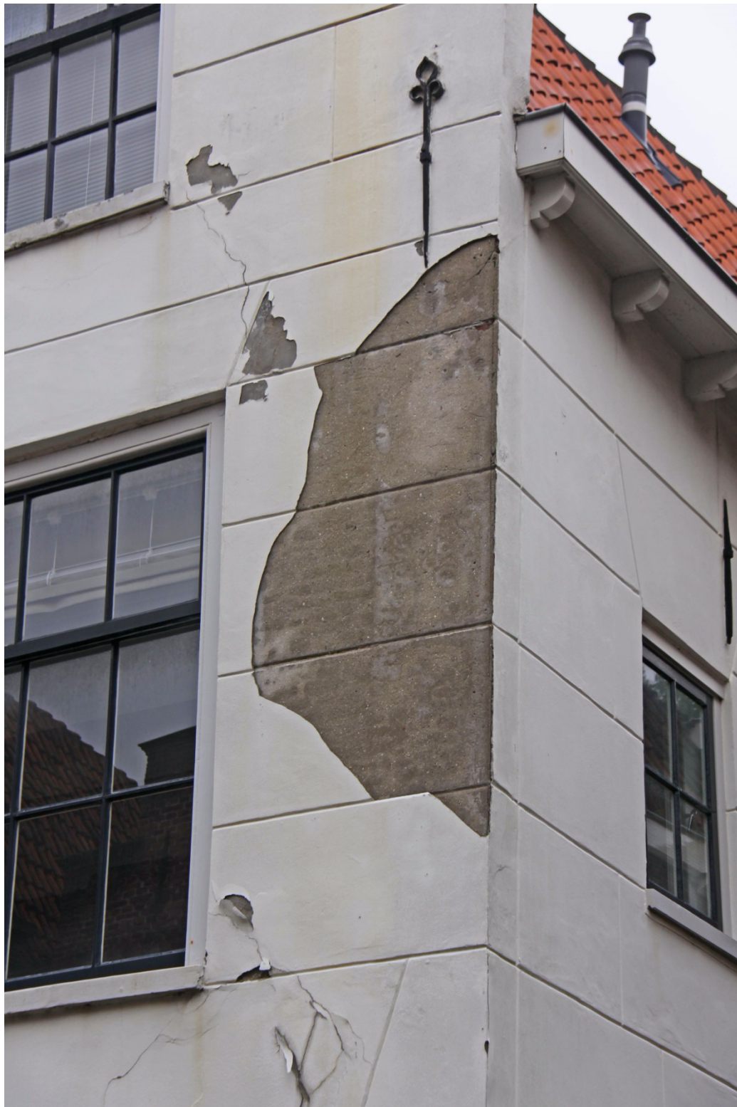
Wegvallende plakken pleisterwerk – bepalen van de oorzaak van het gebrek.