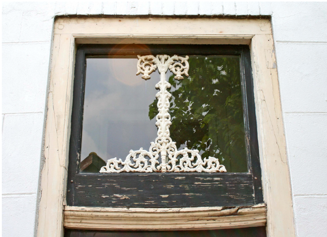
Opnemen van wandopeningen – inzicht in de constructie is bepalend voor het bepalen van de conditiescore op basis van aard, omvang en ernst van het gebrek.